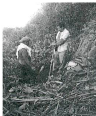
Acompañamiento en la alineación de brecha con colindantes de la comunidad Rumpoc