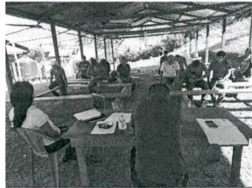
Retroalimentación y asesoró en la aplicación de los estatutos de la AGROSEP.