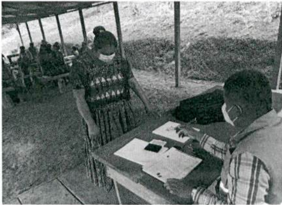
Fase I: Acreditación, como parte de la coordinación interinstitucional con la SOSEP para formación de mujeres en emprendimiento.