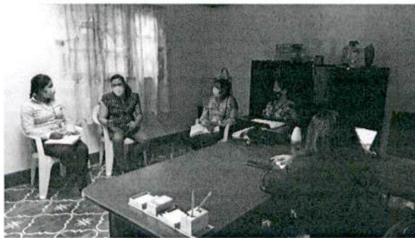
Reunión para coordinar alianzas interinstitucionales para el apoyo al capital humano y social con SOSEP