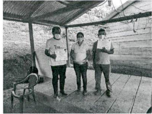
Desarrollo de la activación de gestores de desarrollo