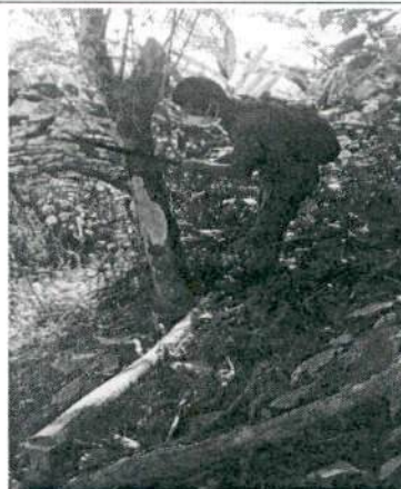
Delimitación del área de sub proyecto de cardamomo con la comisión del proyecto.